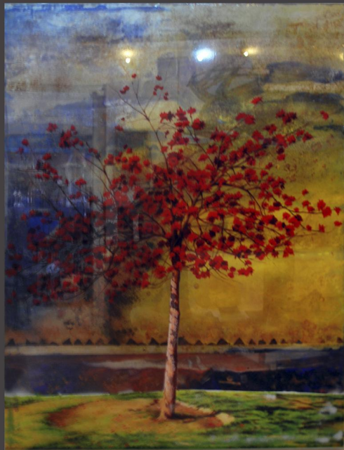
Ricardo Alario. Mixta/metacrílico. 183 X 142,5 cm.