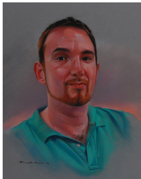
Ricardo Alario. Pastel/papel

Los pasteles son pigmentos en polvo, mezclados con la suficiente goma o resina para aglutinarlos.